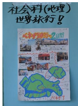
社会科 世界旅行！（パンフレット）