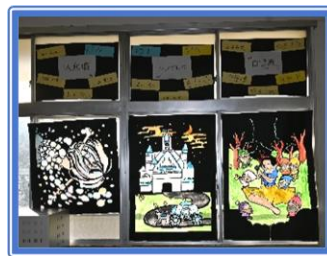
1年2組:「おとぎ話のエモーション」