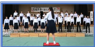
3年1組:「言葉にすれば」

合唱は、複数の人が複数の声部に分かれて各々の声部を複数で歌う声楽の演奏形態のことです。楽器における「合奏」の対語でもあります。(辞書)