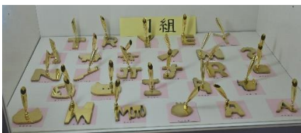
技術科 金工（ペンスタンド）

授業で作製したものが展示されました。子どもたちの思考力や表現力は、想像以上に優れていることがわかりました。